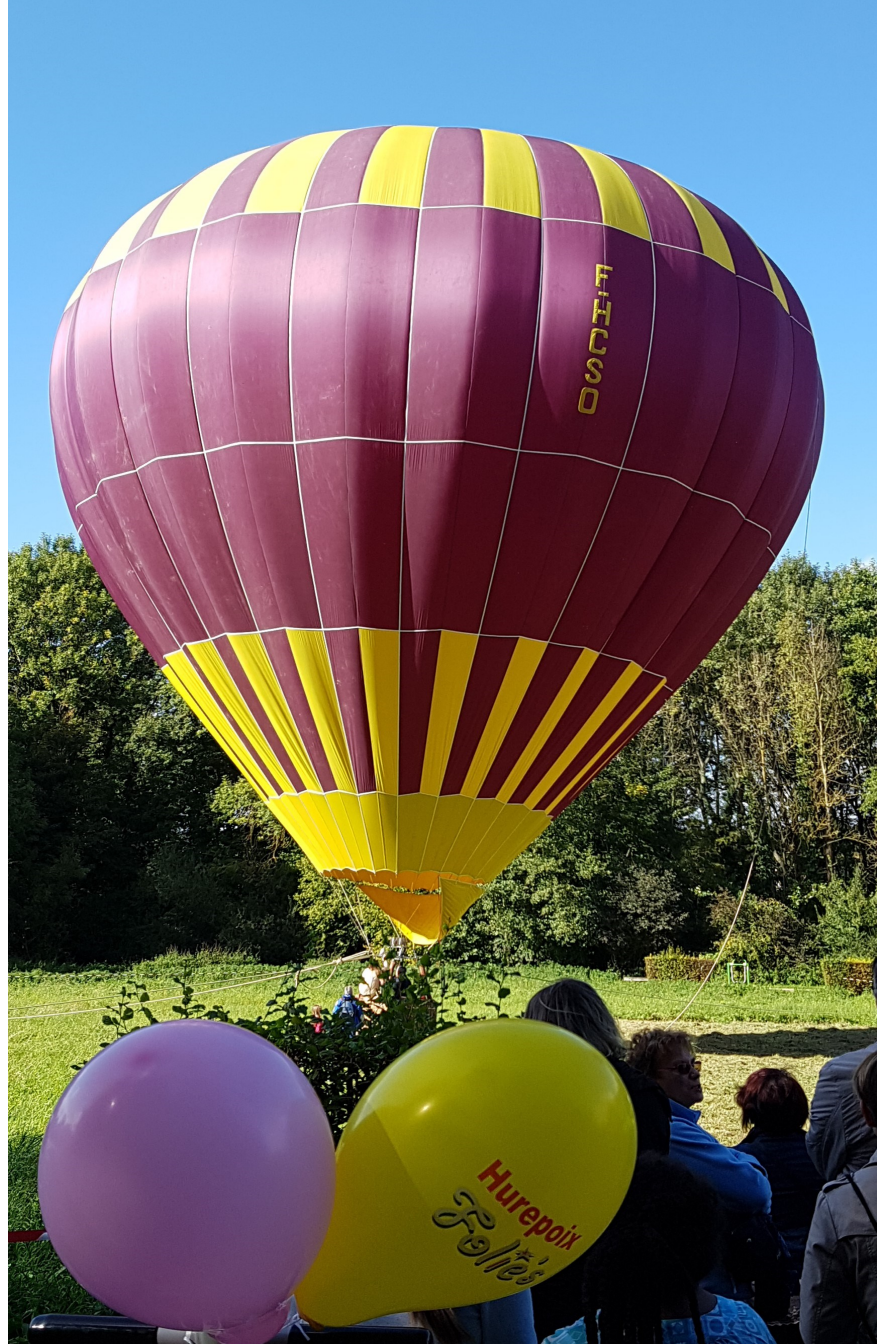
Hurepoix Folie's, première édition....PAGE 10