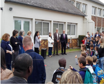
Rentrée des classes...page 5