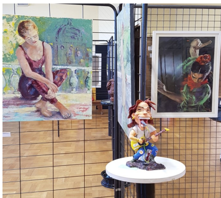
Exposition peintures sculptures...page 8