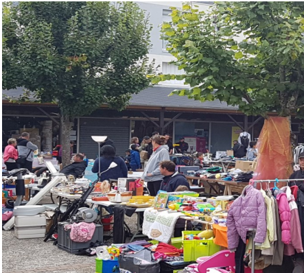
Vide grenier...page 7